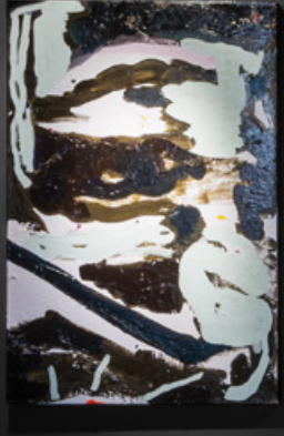
Uyumsuzluk | Tuval Üzerine Yağlı Boya | 92x61cm | 2022