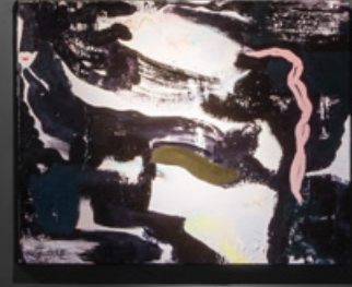
Birlikte-Ayrı | Tuval Üzerine Yağlı Boya | 60x76cm | 2022