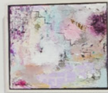
Merdivenler | Tuval Üzerine Yağlı Boya | 20x20cm | 2021