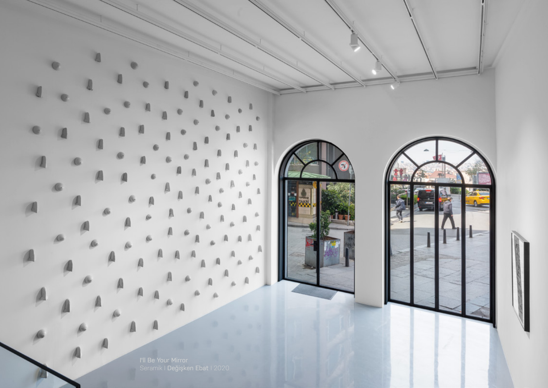
I'll Be Your Mirror Seramik | Değişken Ebat | 2020