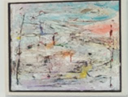
Merdivenler II | Tuval Üzerine Yağlı Boya | 20x20cm | 2021