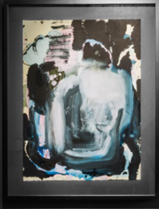
İsimsiz | Kağıt Üzerine Yağlı Boya | 76x56cm | 2022