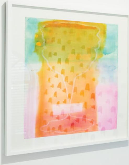
Hortum | Kağıt Üzerine Sulu Boya | 76x56cm | 2020