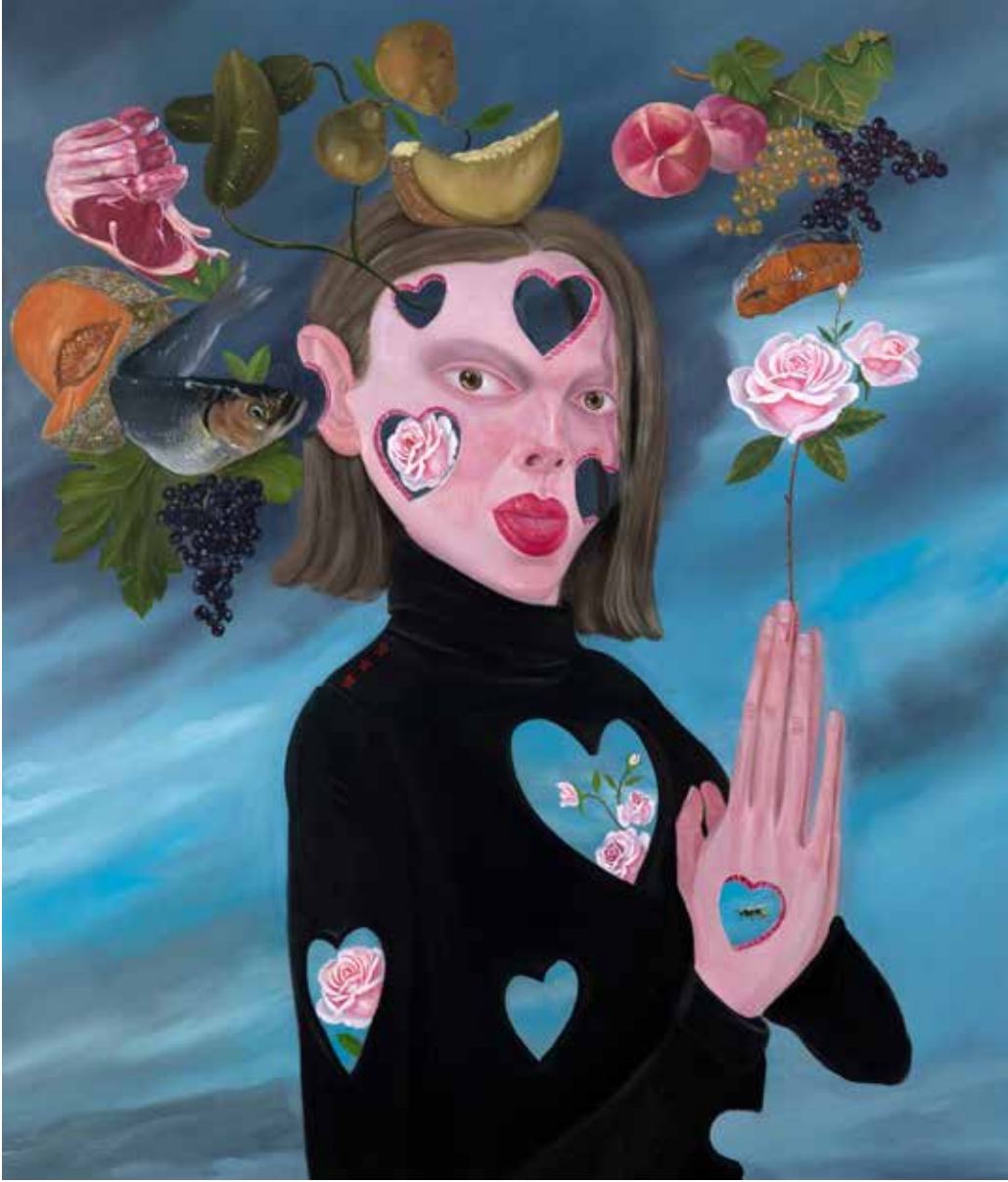
Yaralarımınla Yaşıyorum VIII | I am Living With My Wounds VIII, 2019

Tuval üzerine yağlı boya | Oil on canvas 120 x 100 cm