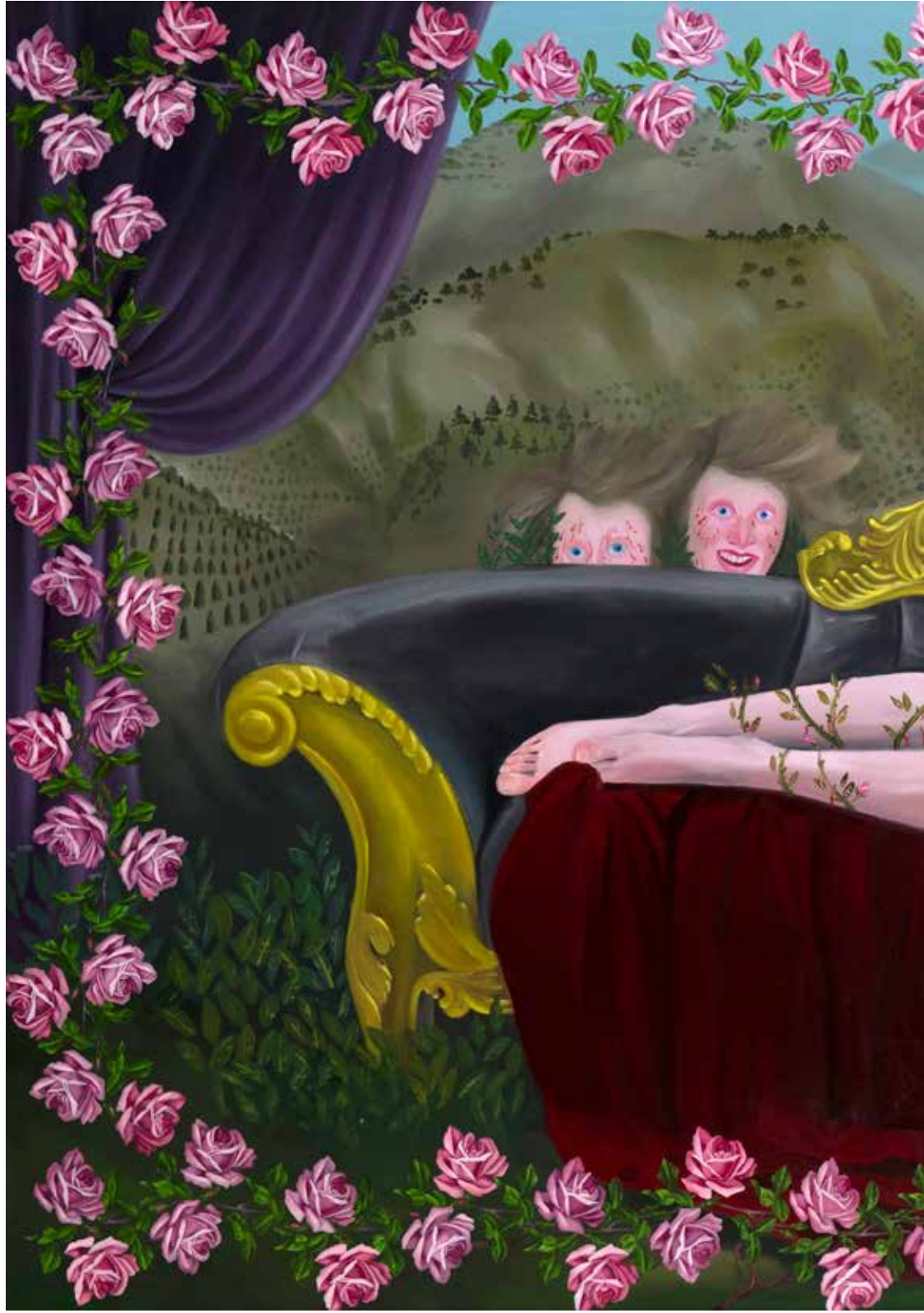
Yaralarım ile Yaşıyorum I | I'm Living With My Wounds I, 2018

Tuval üzerine yağlı boya | Oil on canvas 140 x 230 cm