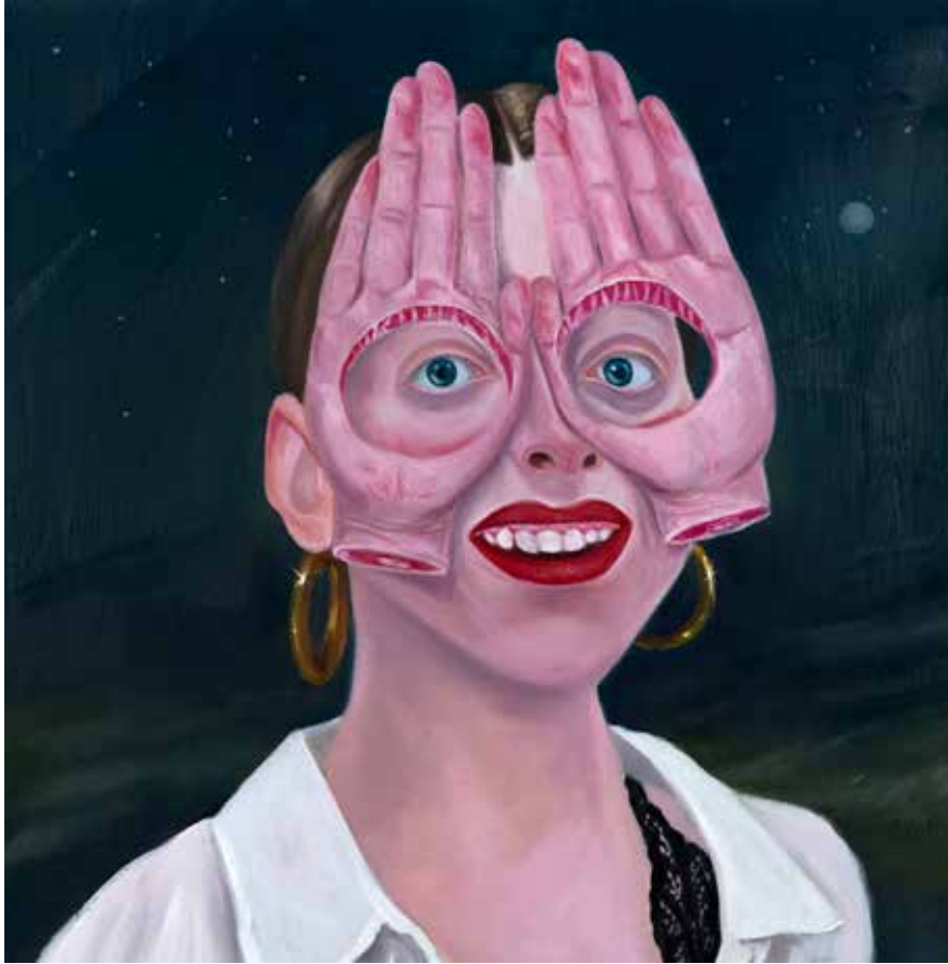
Öülerin Eliyle Sev Beni I Love Me With the Hands of the Dead I, 2019

Tuval üzerine yağlı boya | Oil on canvas 40 x 40 cm