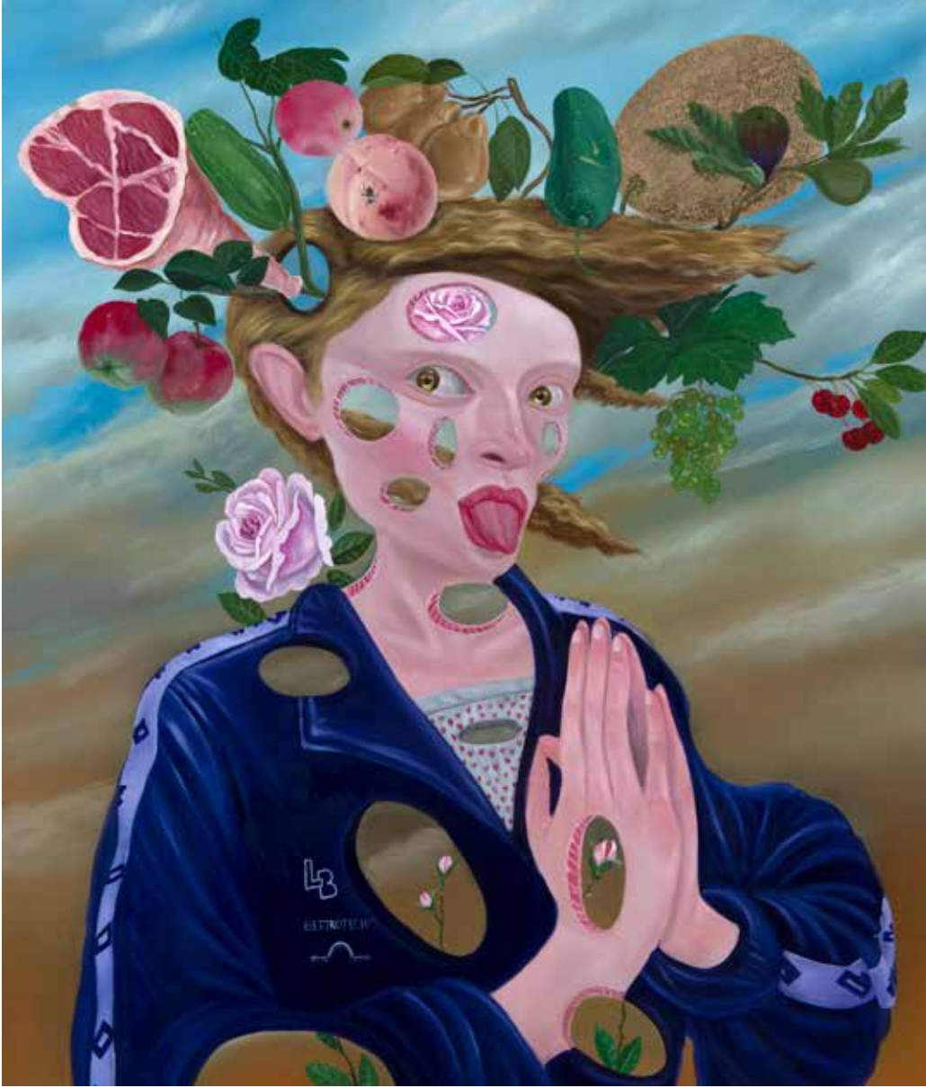
Yaralarımınla Yaşıyorum VI | I am Living With My Wounds VI, 2019

Tuval üzerine yağlı boya | Oil on canvas 120 x 100 cm