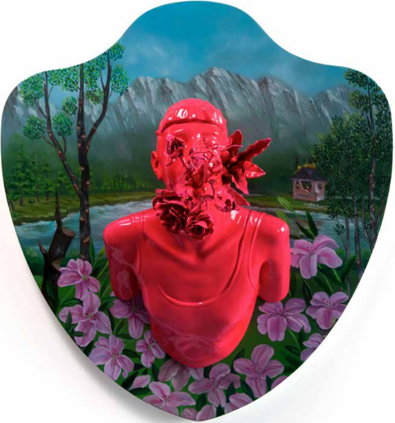
Kan Görünce Rüya Bozulur I | Blood Spoils the Dream I, 2018

Ahşap üzerine yağlı boya & polyester üzerine 2k boya, 2k vernik 2k paint, 2k varnish on polyester and oil on wood g|w 95 cm d|d 56 cm y|h 85 cm