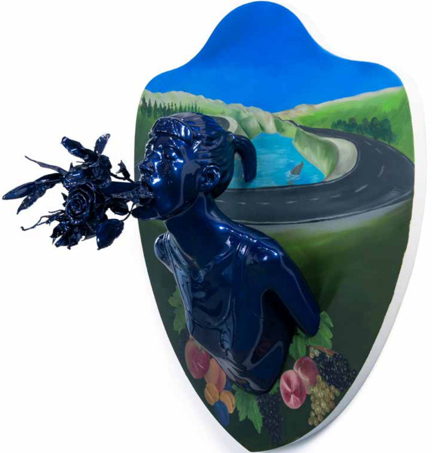
Kan Görünce Rüya Bozular VI | Blood Spoils the Dream VI, 2019

Ahşap üzerine yağlı boya & polyester üzerine 2k boya, 2k vernik 2k paint, 2k varnish on polyester and oil on wood g|w 95 cm d|d 56 cm y|h 85 cm