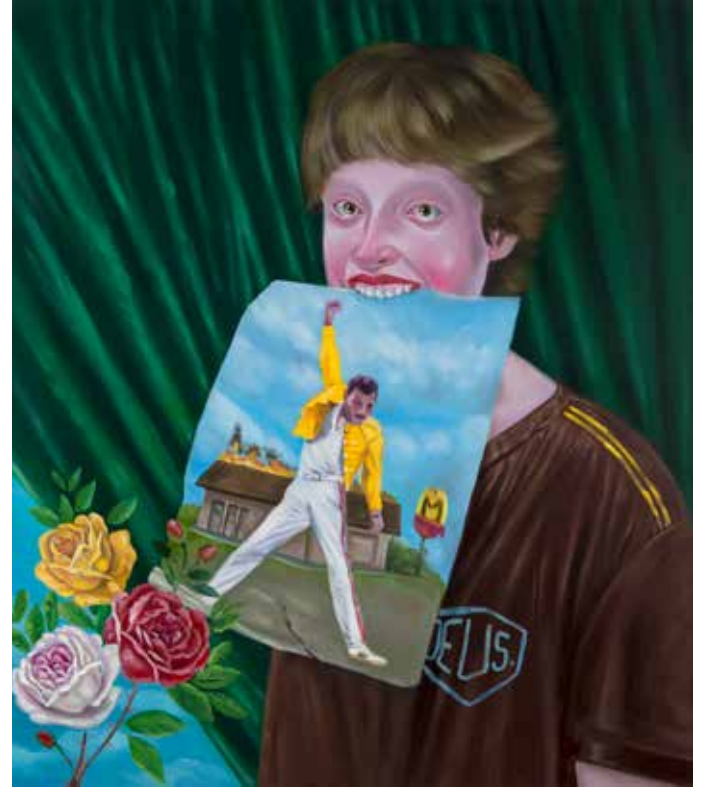
Rabbim Beni Baştan Yarat I | My Lord Recreate Me I, 2018

Tuval üzerine yağlı boya | Oil on canvas 60 x 50 cm