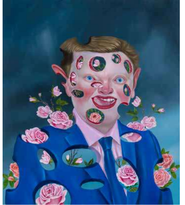
Yaralarım İle Yaşıyorum II-III I am Living With My Wounds II-III, 2018

Tuval üzerine yağlı boya | Oil on canvas 75 x 65 cm