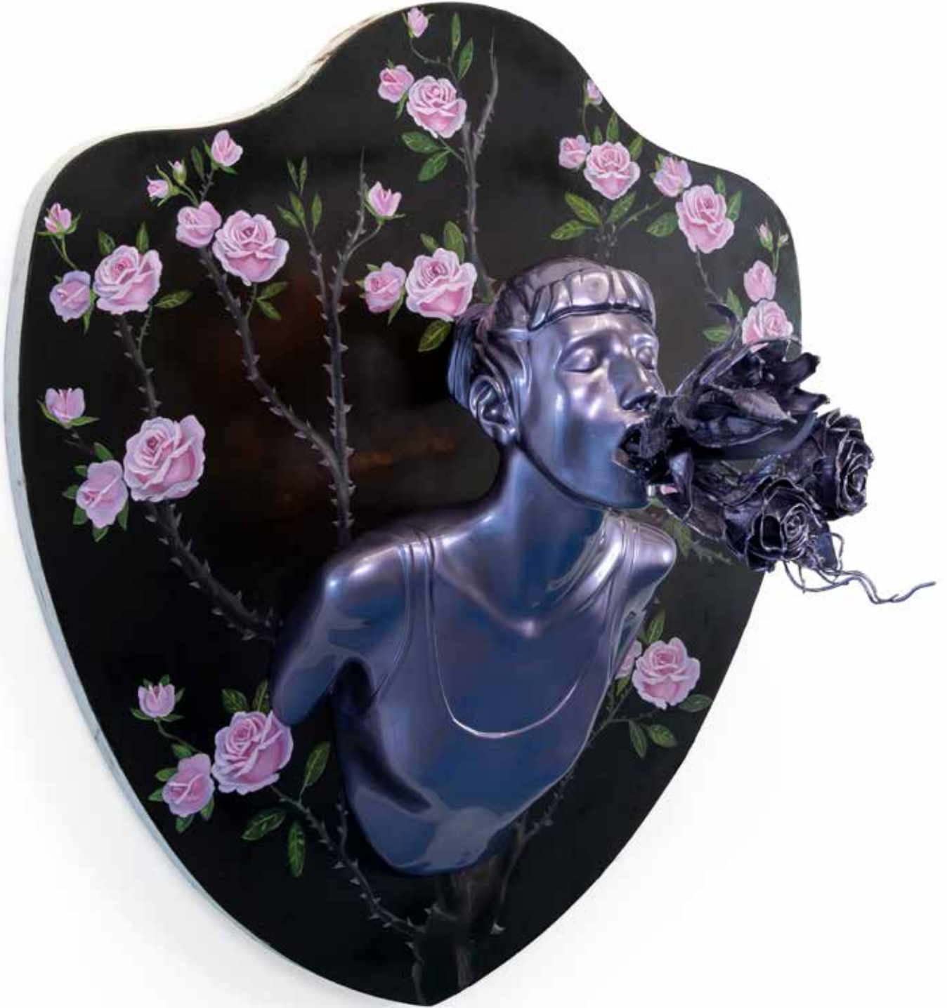
Kan Görünce Rüya Bozular IV | Blood Spoils the Dream IV, 2019

Ahşap üzerine yağlı boya & polyester üzerine 2k boya, 2k vernik 2k paint, 2k varnish on polyester and oil on wood g|w 95 cm d|d 56 cm y|h 85 cm