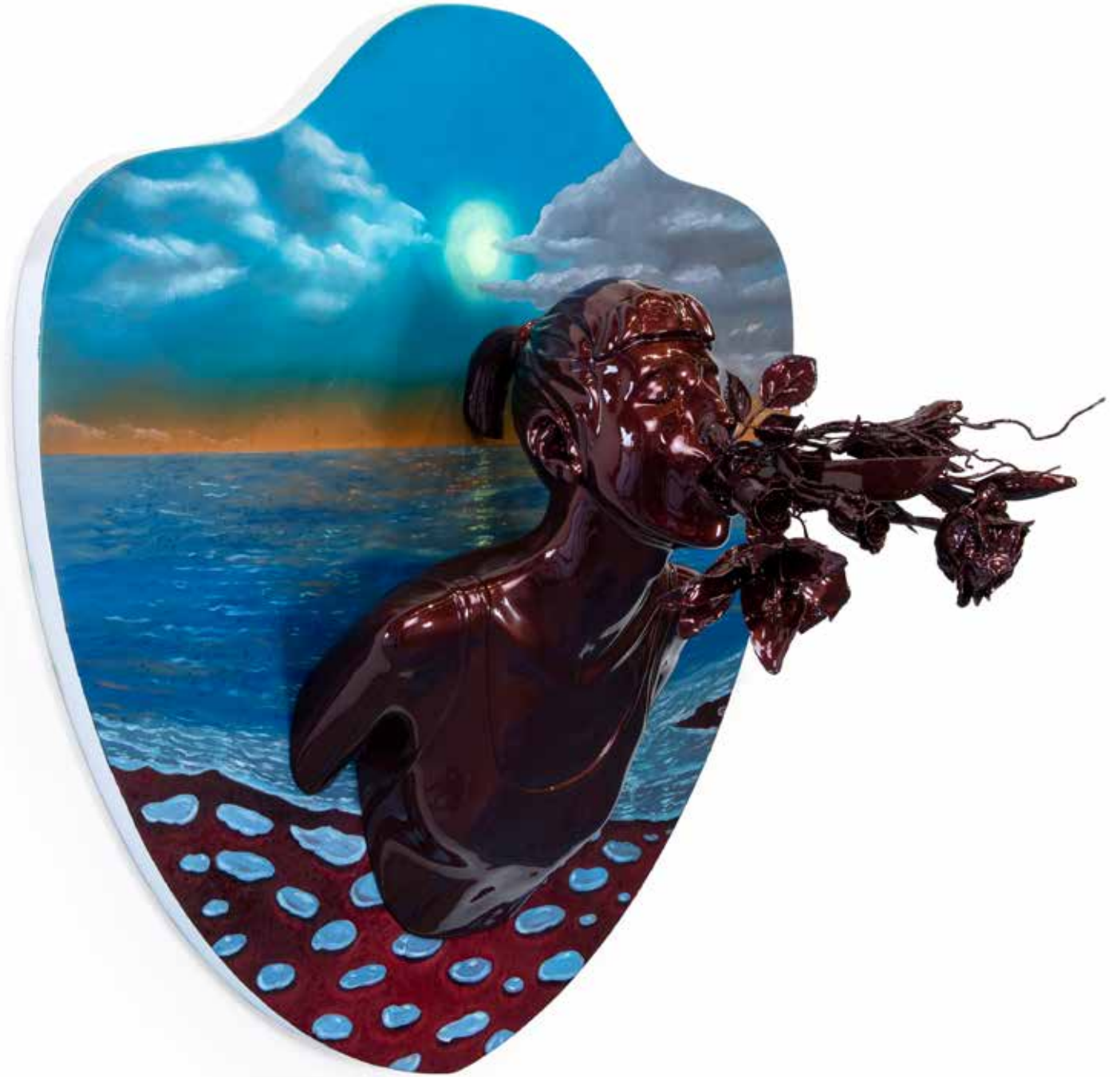
Kan Görünce Rüya Bozulur V | Blood Spoils the Dream V, 2019

Ahşap üzerine yağlı boya & polyester üzerine 2k boya, 2k vernik 2k paint, 2k varnish on polyester and oil on wood g|w 95 cm d|d 56 cm y|h 85 cm