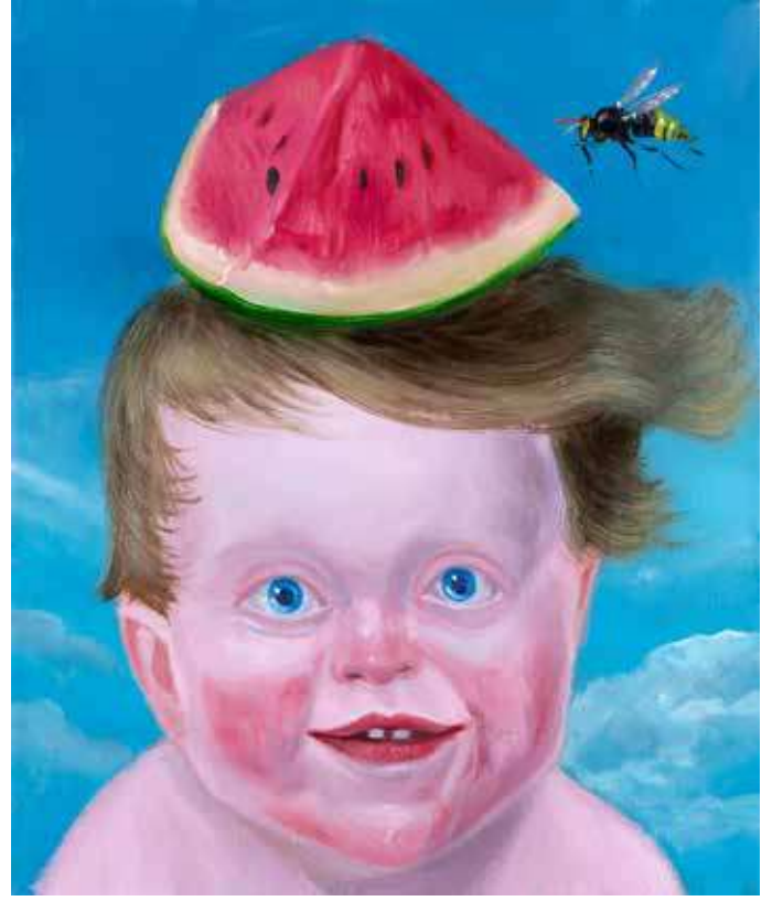
Yaralarım ile Büyüyorum I | I am Growing with My Wounds I, 2019

Tuval üzerine yağlı boya | Oil on canvas 30 x 25 cm