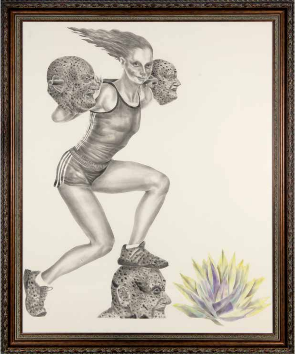
Senin Gibi Olmak İstiyorum II | I Want to be Like You II, 2019

Kâğıt üzerine karışık teknik | Mixed media on paper 170 x 140 cm