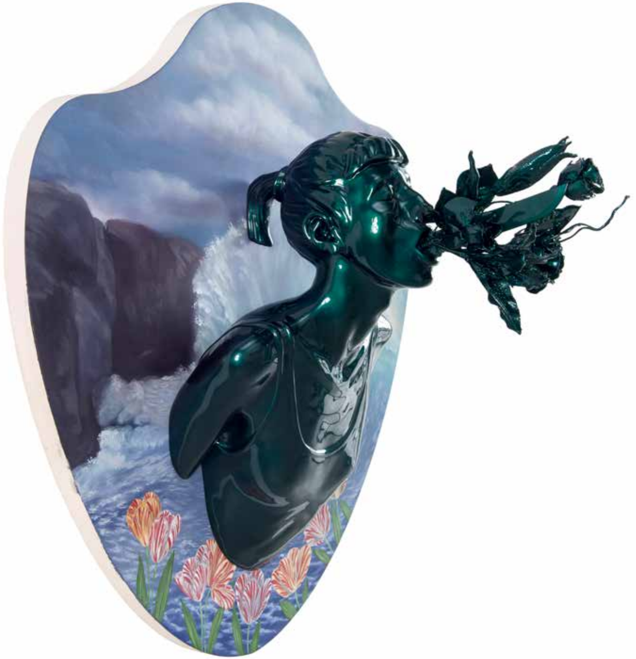
Kan Görünce Rüya Bozulur III | Blood Spoils the Dream III, 2018

Ahşap üzerine yağlı boya & polyester üzerine 2k boya, 2k vernik 2k paint, 2k varnish on polyester and oil on wood glw 95 cm d|d 56 cm y|h 85 cm