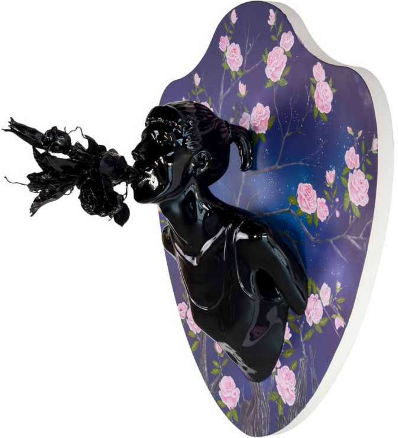
Kan Görünce Rüya Bozulur II | Blood Spoils the Dream II, 2018

Ahşap üzerine yağlı boya & polyester üzerine 2k boya, 2k vernik 2k paint, 2k varnish on polyester and oil on wood g|w 95 cm d|d 56 cm y|h 85 cm