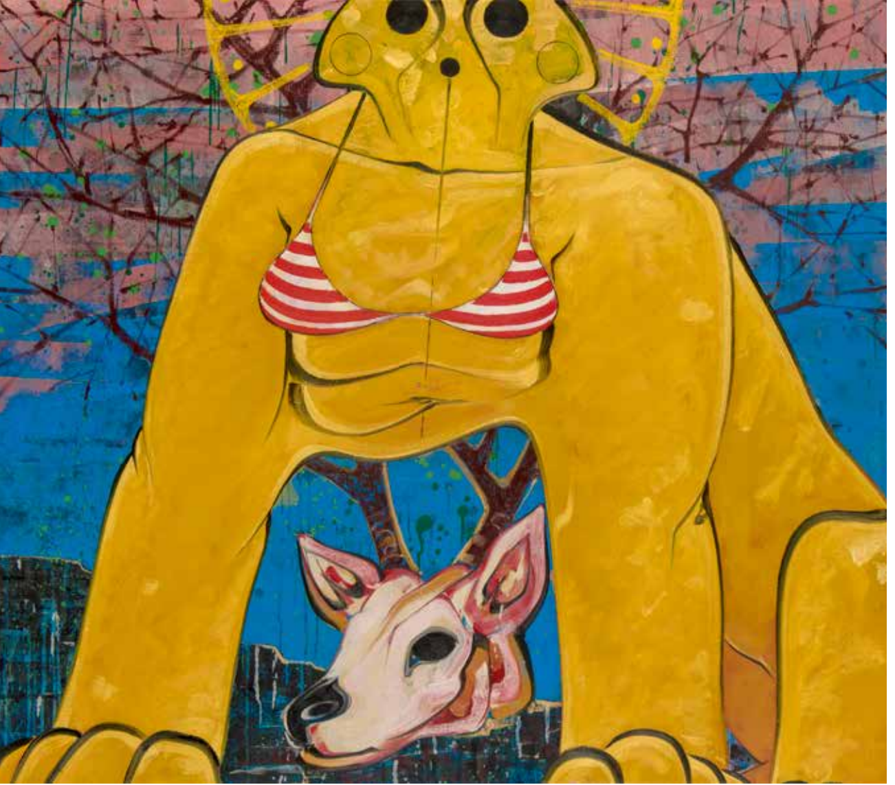
İsimsiz | Untitled, 2019 Tuval üzerine karışık teknik Mixed media on canvas 122 x 140 cm