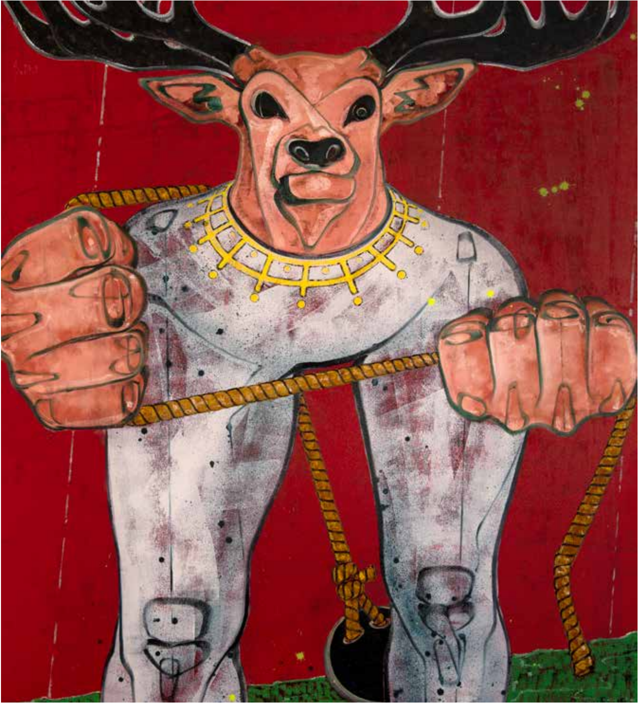
İsimsiz | Untitled, 2019 Tuval üzerine karışık teknik Mixed media on canvas 160 x 140 cm