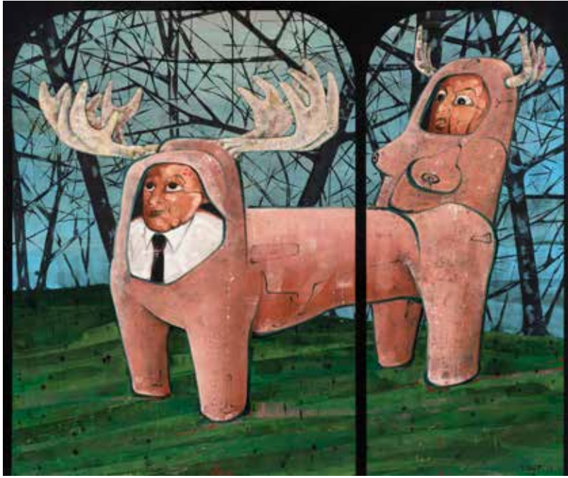
İsimsiz | Untitled, 2019 Tuval üzerine karışık teknik | Mixed media on canvas 167 x 200 cm