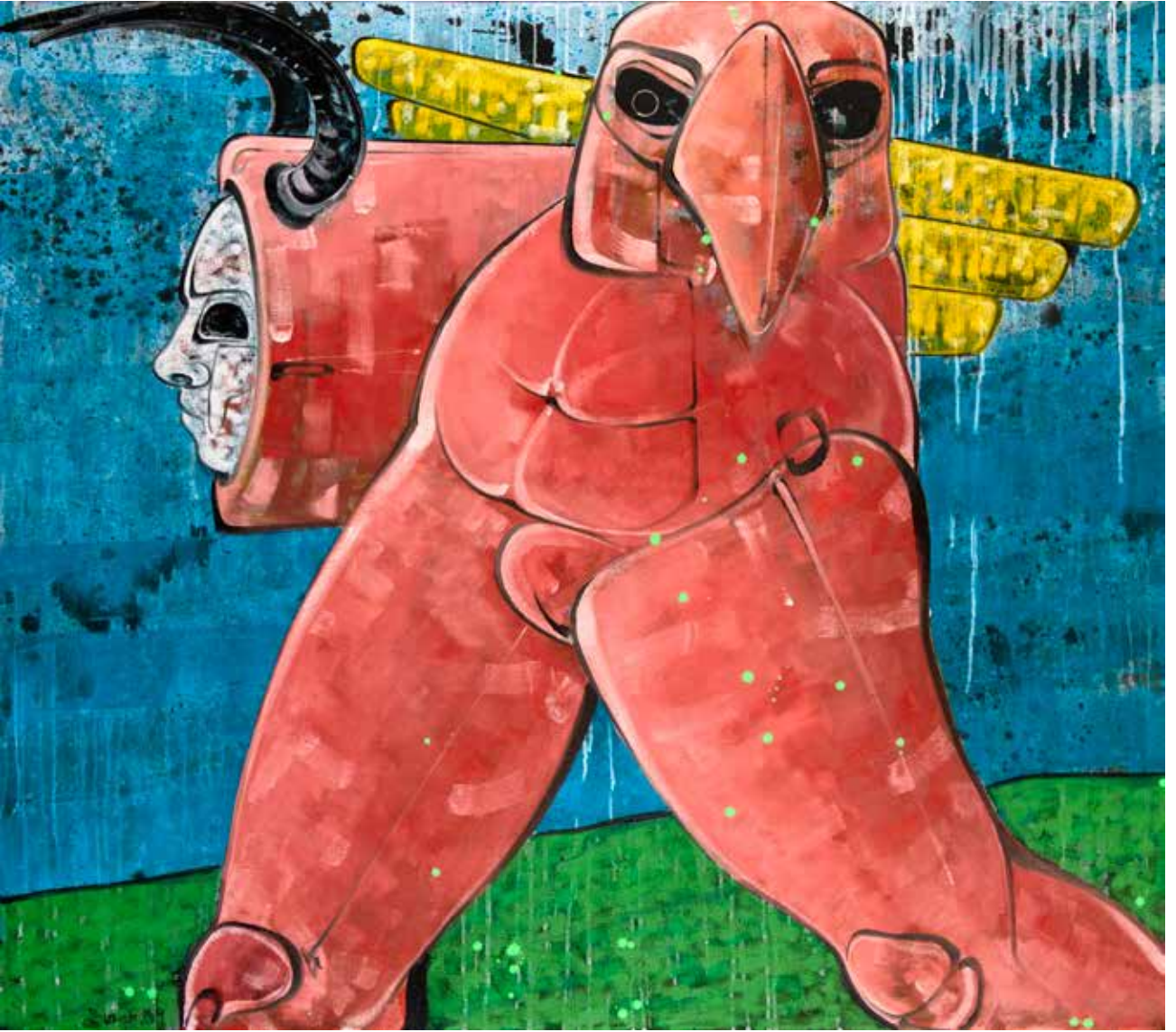
İsimsiz | Untitled, 2019 Tuval üzerine karışık teknik Mixed media on canvas 140 x 160 cm