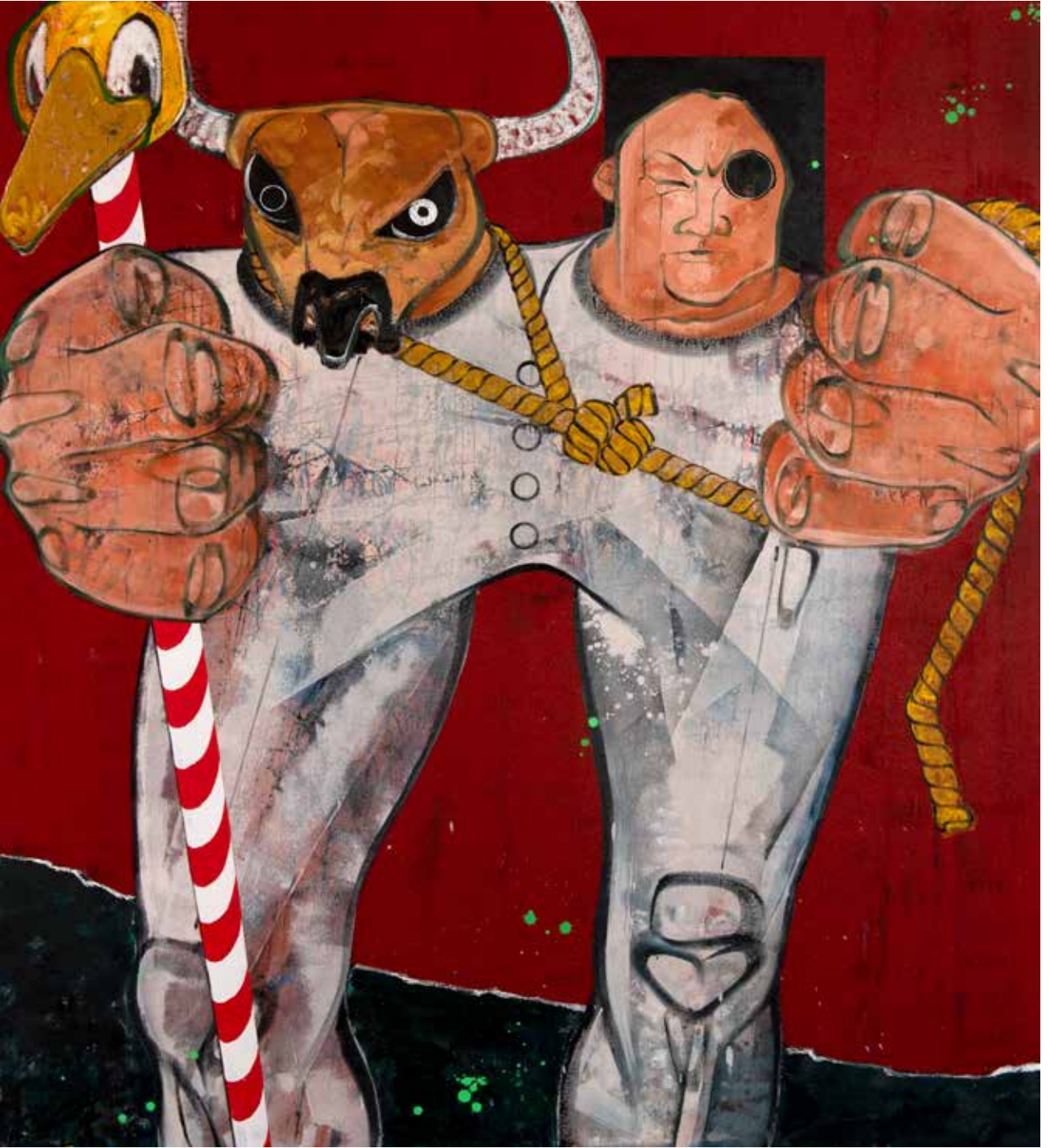
İsimsiz | Untitled, 2019 Tuval üzerine karışık teknik Mixed media on canvas 160 x 140 cm