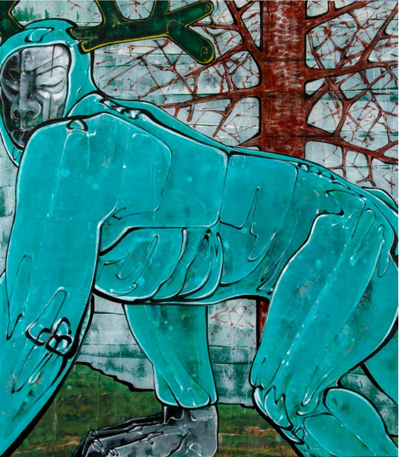
İsimsiz | Untitled, 2019 Tuval üzerine karışık teknik Mixed media on canvas 160 x 140 cm