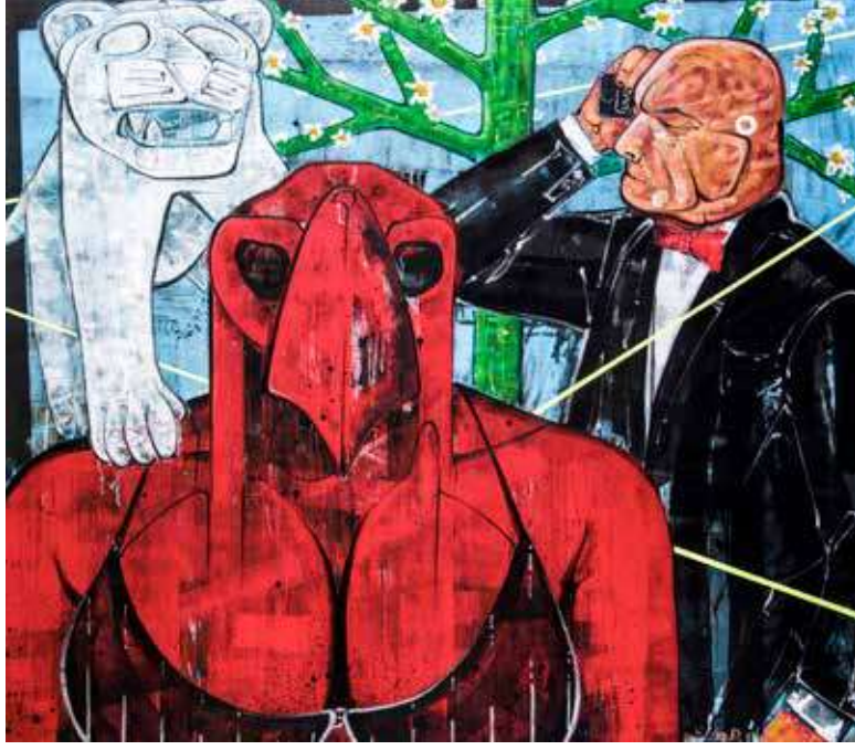
İsimsiz | Untitled, 2019 Tuval üzerine karışık teknik | Mixed media on canvas 140 x 160 cm

Douglas Smith, ayrıntılı önsözünde Tragedyanın Doğuşu 'nun kendinden sonra gelen pek çok çalışma için kaynaklık ettiğini gösteriyordu. Bunların arasında en belirgin olanı ismini Nietzsche'nin bu ilk kitabından alan Büyülü Dağ 'dır. Romanın yayımlanmasından beş yıl sonra Nobel Edebiyat Ödülü'nü kazanan Thomas Mann, bu eserinde açıkça Dionysosçu ilkeler doğrultusunda hareket eden Mynheer Peeperkorn isimli grotesk bir karaktere de yer verir. Smith'e göre başka romanlarıyla birlikte Mann'ın çalışmaları genel olarak Tragedyanın Doğuşu 'nda psikanalizin öne sürdüğü bazı kavramların öncüllerinin bulunduğunu gösterir. 6 Nietzsche'nin bilinçaltından ve rüyalardan bahsetmesi, "güdü" terimini kullanması psikanalizin ilgilendiği konuları çağırıştırır. Apollon ve Dionysos arasındaki hem karşıtlık hem de karşılıklı bağımlılık çerçevesinde kurgulanan ilişki de psikanalizde Eros ve Thanatos ile simgelenen şehvet ve ölüm güdüleri arasındaki ilişkiye benzer. Sungur'un resmi de insan psikolojisine duyduğu derin ilgi düşünüldüğünde yukarıda bahsedilen kavramların hiç de uzağında yer almaz. Eğer biz de Smith gibi Tragedyanın Doğuşu 'nu antik Yunan tragedyasının kökenini araştıran bir çalışmadan çok kültürel fenomenleri incelemek üzere çerçeveler ve kavramlar sunan bir yapıt olarak değerlendirirsek, Sungur'un resminde Apollon'u ve Dionysos'u nerede aramak gerekir?