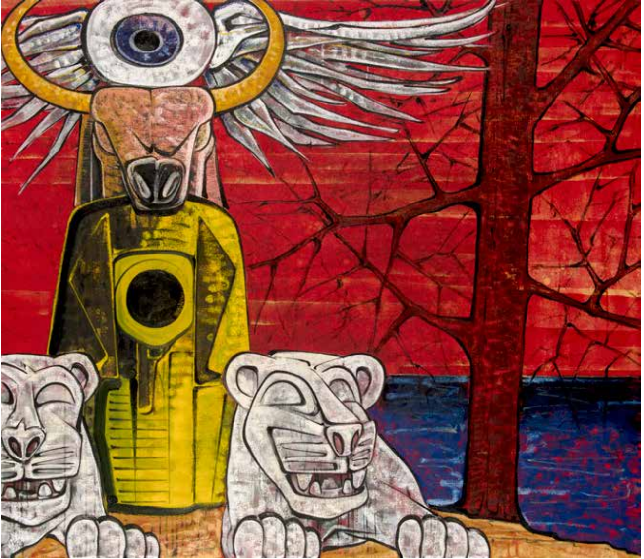
İsimsiz | Untitled, 2019 Tuval üzerine karışık teknik Mixed media on canvas 140 x 160 cm