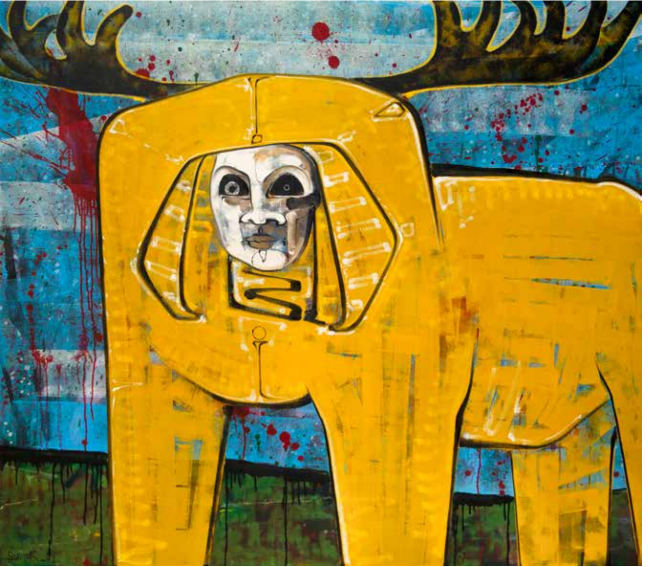
İsimsiz | Untitled, 2019 Tuval üzerine karışık teknik Mixed media on canvas 140 x 160 cm