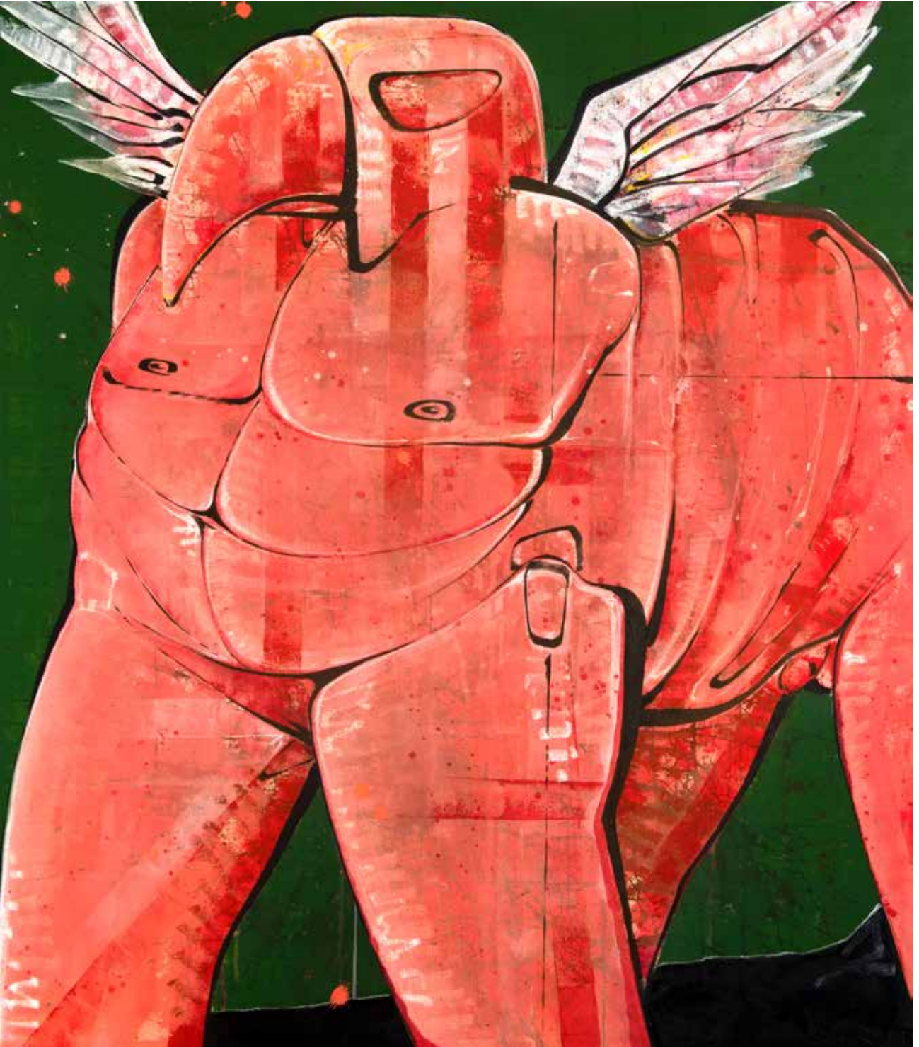
İsimsiz | Untitled, 2019 Tuval üzerine karışık teknik Mixed media on canvas 160 x 140 cm