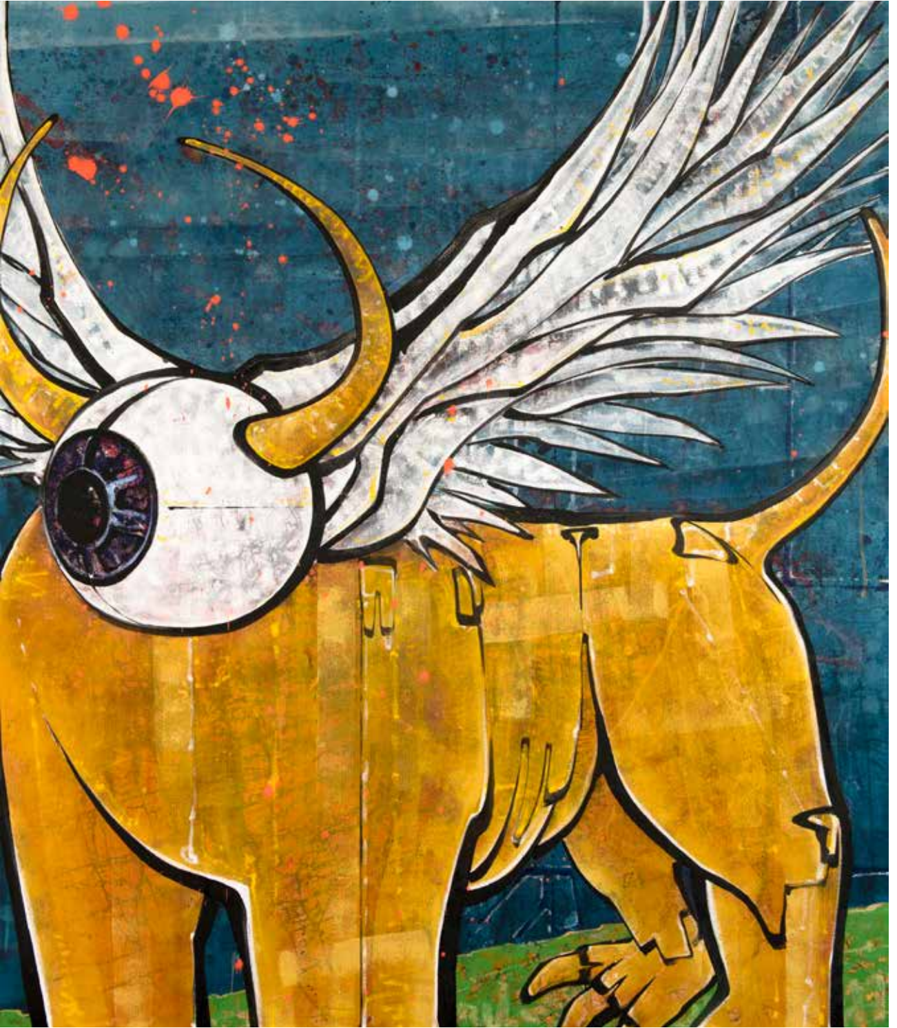
İsimsiz | Untitled, 2019 Tuval üzerine karışık teknik Mixed media on canvas 160 x 140 cm