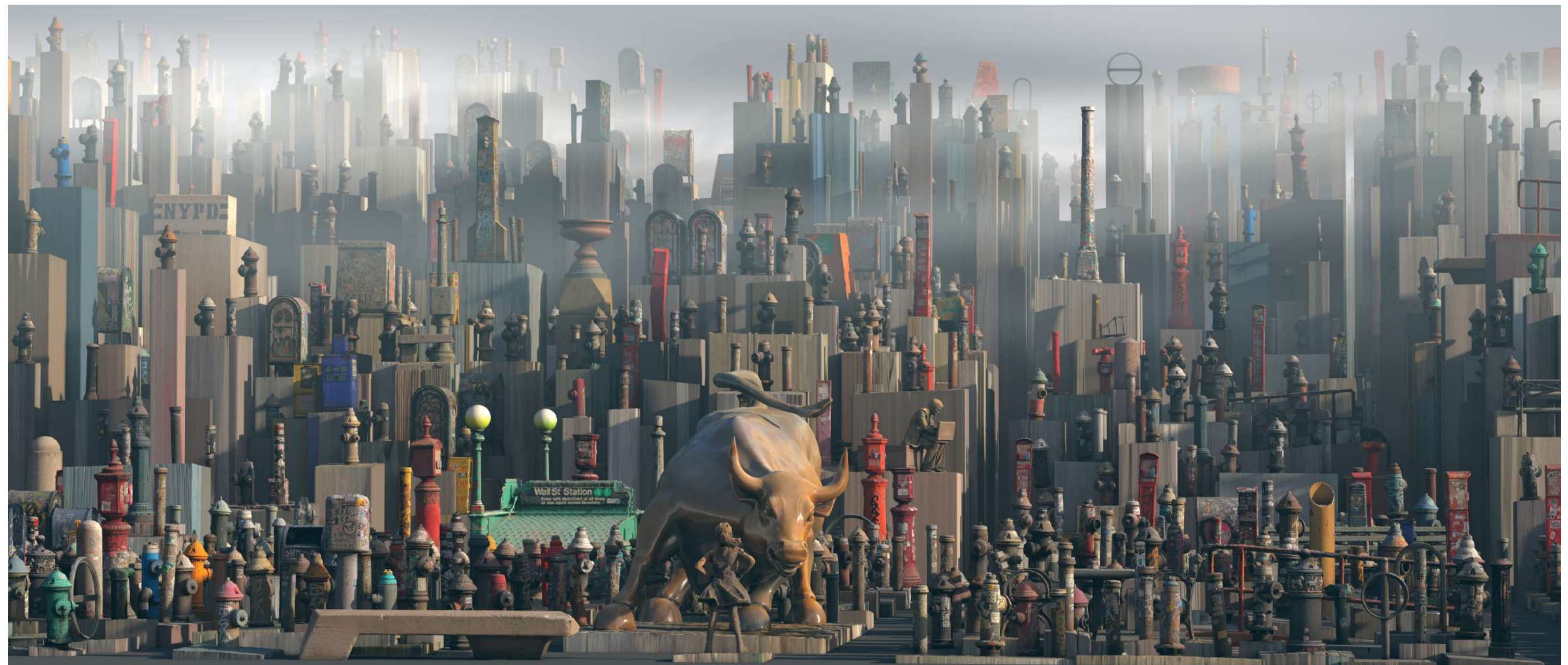
Manhattan II , 2018 Fotogrametrik sanal yerleştirme | Photogrammetric virtual installation Diasec print | Diasec baskı 106 x 250 cm / Ed. 5 + 1 ap