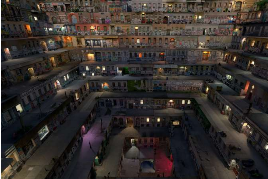
Kreuzberg II , 2018 Fotogrametrik sanal yerleştirme | Photogrammetric virtual installation Diasec print | Diasec baskı 150 x 266 cm / Ed. 5 + 1 ap Sanatsal baskı | Fine art print 100 x 150 cm / Ed. 5 + 1 ap