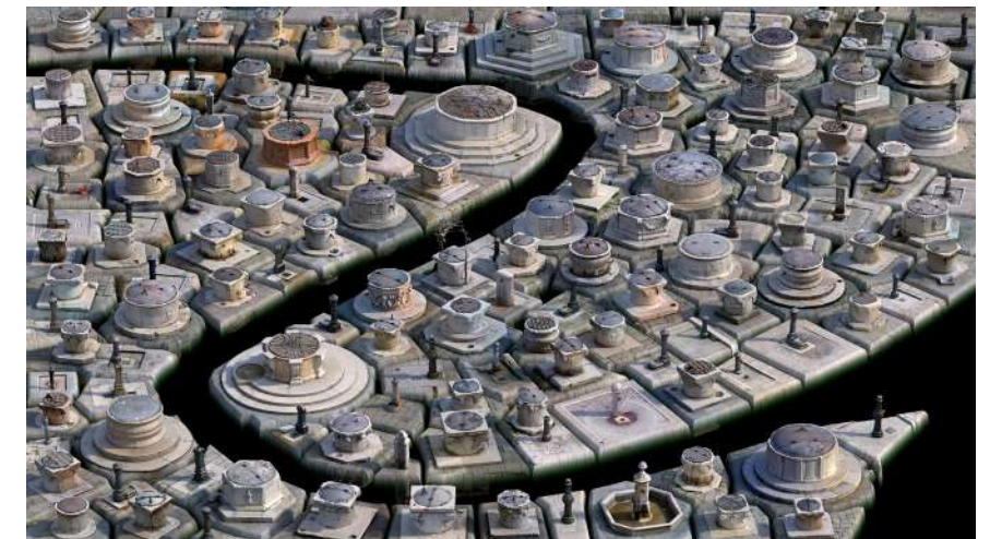
Venedik I , 2018 Fotogrametrik sanal yerleştirme | Photogrammetric virtual installation Diasec print | Diasec baskı 150 x 266 cm / Ed. 5 + 1 ap | 84 x 150 cm / Ed. 5 + 1 ap