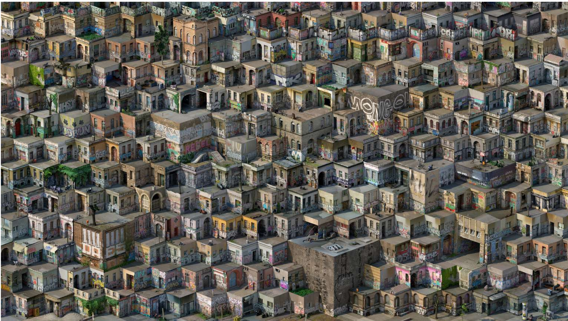
Kreuzberg I , 2018 Fotogrametrik sanal yerleştirme | Photogrammetric virtual installation Diasec print | Diasec baskı 150 x 266 cm / Ed. 5 + 1 ap | 84 x 150 cm / Ed. 5 + 1 ap