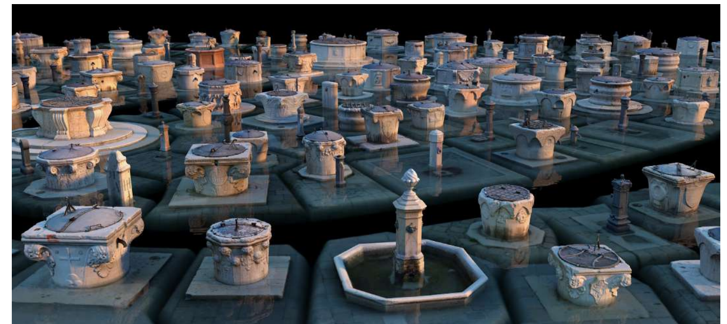
Venedik II , 2018 Fotogrametrik sanal yerleştirme Photogrammetric virtual installation Sanatsal baskı | Fine art print 80 x 175 cm / Ed. 5 + 1 ap