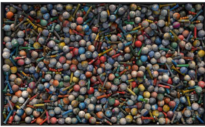
Kadıköy II , 2018 Fotogrametrik sanal yerleştirme | Photogrammetric virtual installation Sanatsal baskı | Fine art print 90 x 150 cm / Ed. 5 + 1 ap