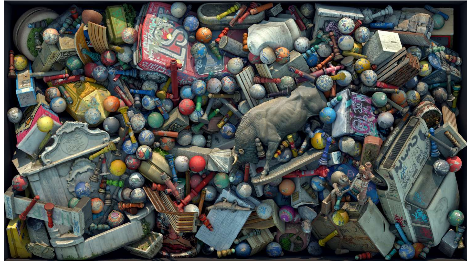
Kadıköy I, 2018 Fotogrametrik sanal yerleştirme | Photogrammetric virtual installation Diasec print | Diasec baskı 150 x 266 cm / Ed. 5 + 1 ap | 84 x 150 cm / Ed. 5 + 1 ap

Many local authorities in the West pay extra attention to maintaining street furniture to create an identity for the city. An example of this can be seen in Kadıköy, Bahariye Street's street furniture designs. Municipality of Kadıköy takes care of these ballards by painting them in different colours and naming them. Recently, the municipality re-painted the bollards and it is possible to see the old versions of these objects from the works of Oddviz. This concept of capturing change conveys the documentary feature of Oddviz's works. All of the works in the exhibition are scaled according to their real-life size. During the production phase of the works Oddviz spent a great amount of time in each of the neighbourhoods. Apart from the photo shoots, they gathered a large sum of information about the characteristics of each city. These street furnitures that are powerful on their own, further grow in depth once they're combined with others. Oddviz prefers to portray these wholesome compositions by creating patterns. These patterns reflect the reference of these street furniture while highlighting spatial understanding.