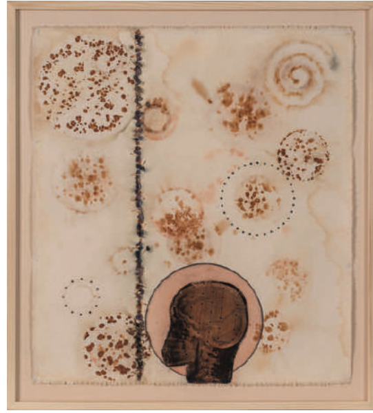
AHMET ÇERKEZ İsimsiz Untitled 2016 Tuval üzerine karışık teknik Mixed media on canvas 76 x 68 cm