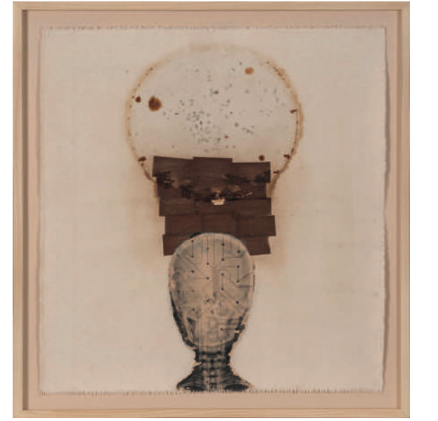
AHMET ÇERKEZ İsimsiz Untitled 2016 Tuval üzerine karışık teknik Mixed media on canvas 76 x 68 cm