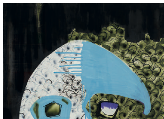
OLGU ÜLKENCİLER Miğfer 5 Helmet 5 2017 Kâğıt üzerine karışık teknik Mixed media on paper 56 x 76 cm