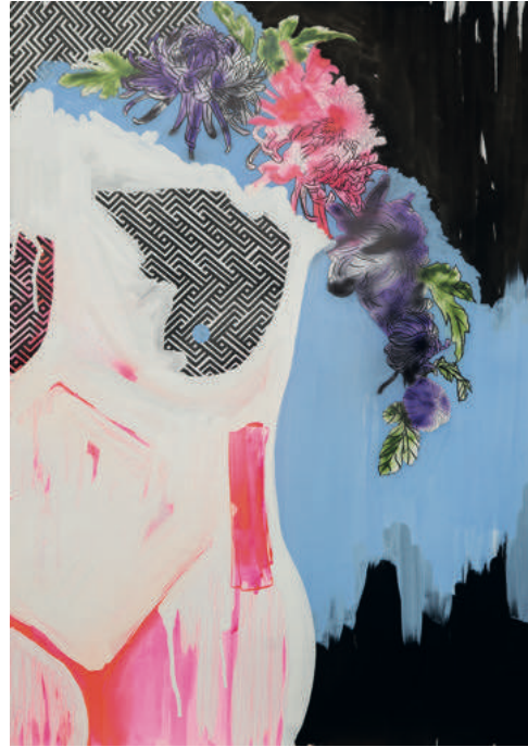
OLGU ÜLKENCİLER Yeni İnsan 1 The New Human 1 2017 Kâğıt üzerine karışık teknik Mixed media on paper 100 x 70 cm

Olgü Ülkenciler, renk karşıtlıkları, tipografik ve illüstratif öğeler kullandığı eserlerinde toplumu kendi konumundan yola çıkarak bir eleştiri süzgecinden geçiriyor. Yeni İnsan serisinde kadın bedenini kullanarak, toplum içinde, toplumla şekillenen kadınlık, cinsellik gibi konulara değinirken kompozisyon içine kattığı devrimci isimleri de karşıt tavrını yansıtmak için kullanıyor. Ülkenciler'in Miğfer serisi de yine toplumun etkisindeki bireyi ele alıyor.