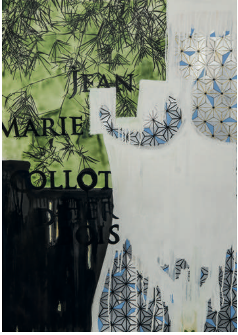
OLGU ÜLKENCİLER Yeni İnsan 2 The New Human 2 2017 Kâğıt üzerine karışık teknik Mixed media on paper 100 x 70 cm

Art On İstanbul Meşrutiyet Cad. Oteller Sok. Hanif Binası No: 90A Tepebaşı, İstanbul T 0212 259 15 43 www.artonistanbul.com Salı-Cumartesi 10.00-19.00 Tuesday-Saturday 10 am-7 pm