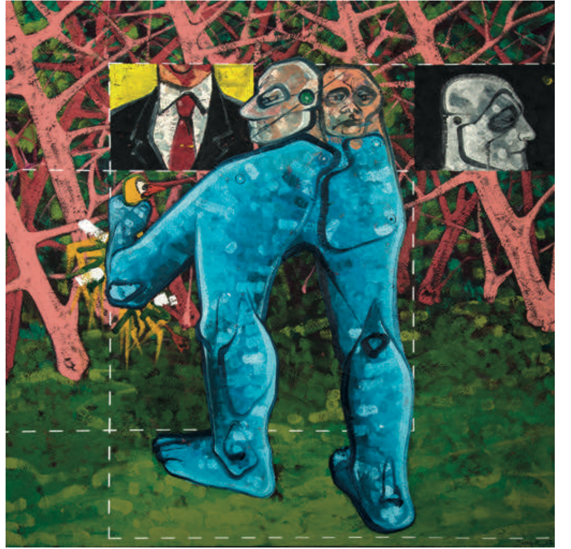
EVREN SUNGUR, Avcı 2, Hunter 2, 2017. Tuval üzerine yağlı boya Oil on canvas 200 x 200 cm