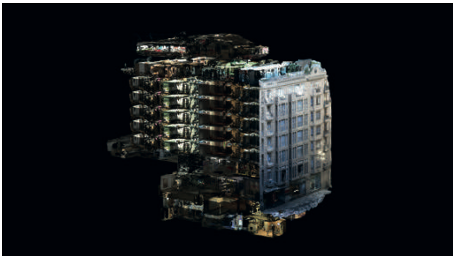
ERDAL İNCİ Otel Hotel 2017 Fotogrametrik video ultraHD Photogrammetric video ultraHD 2'30" Ed. 3 / 5 + 2

Erdal İnci sergiye hareket, mekân ve zaman kavramları üzerine şekillendirdiği video eserleriyle katılıyor. Sanatçı, yapıtlarında sıklıkla şehirlerin ve kendisinin tekrar eden imgelerini kullanırken, bazen de farklı mekanları bir araya getiriyor. Bunu mekânı yüzlerce kez fotoğrafladıktan sonra onları üç boyutlu bir görüntüye çevirdiği fotogrametri tekniği ile yapıyor. Döngüler aracılığıyla yaratılan zamansızlık ve sonsuzluk hissi sanatçının tüm yapıtlarında kendini gösteriyor.