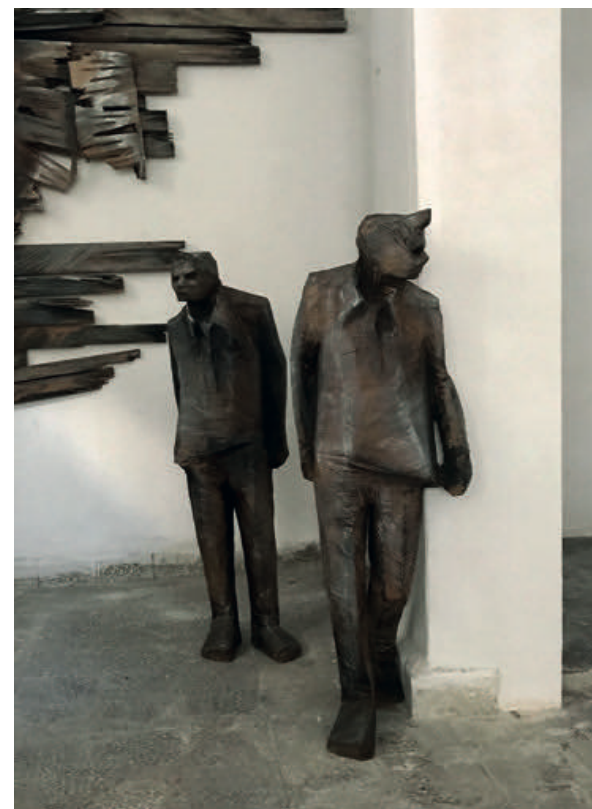
BURCU ERDEN İsimsiz Untitled 2016 Ağaç Wood y l h 112 x 60 x 110 cm

Erdal İnci mainly known with his video works, is most recent work The Hotel, shaped on the concepts of motion, space and time. The artist uses repetitive images of certain cities and brings together the images of different spaces. In order to do this, he uses the technique, photogrammetry, where he shots many poses of the same space and converts them into a 3D image. Feelings of eternity and absence of time appears as prominent features of İnci's practice.