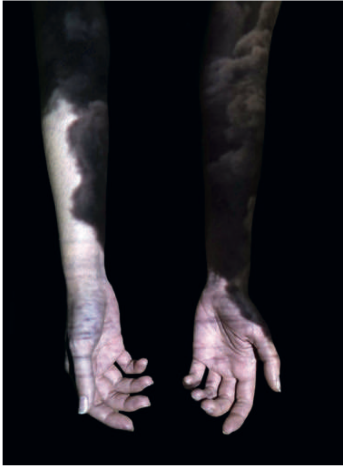
Onur Mansız Inertia 2017 Tuval üzerine yağlı boya Oil on canvas 170 x 125 cm

Onur Mansız, hiper-realist bir üslup ile yaptığı eserlerinde birey ve otorite ilişkisini işliyor. Toplum içinde sıklıkla saklanması, kapanması beklenen insan bedeni ve bölümlerini açıkça resmetmesi otoriteye karşı bir tavır içeriyor. Sanatçının kontrast renkler ve ışık-gölge kullanımı sanki bir sorgu ışığı gibi bedenlerin üzerine düşerek gizemli bir atmosfer yaratıyor. Sergide yer alan Inertia adlı eserinde ellerin neden ve neye açıldığı muamması bu mistik havayı derinleştiriyor.