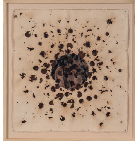
AHMET ÇERKEZ İsimsiz Untitled 2016 Tuval üzerine karışık teknik Mixed media on canvas 76 x 68 cm