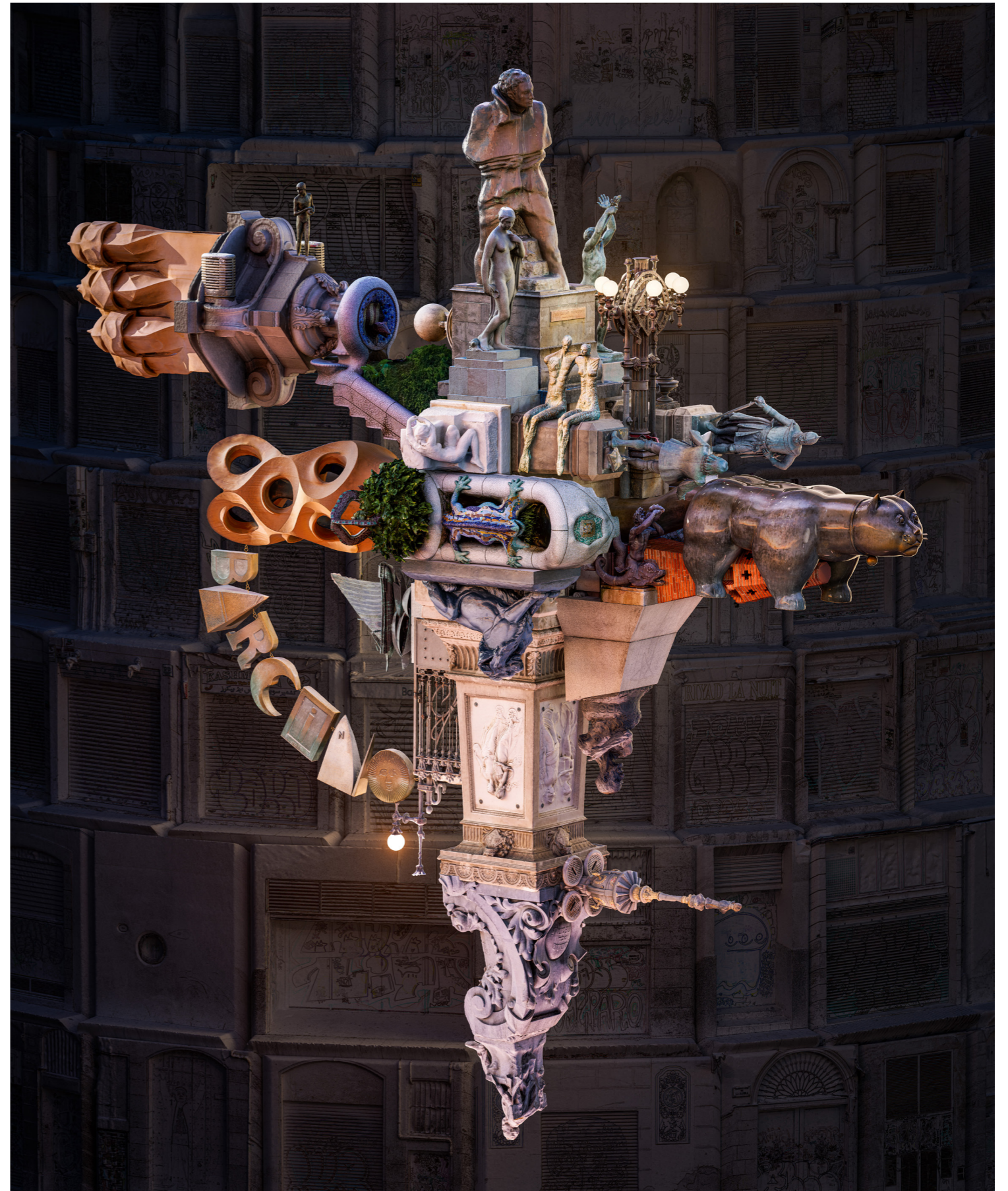
Barcelona III, 2024 Arşivsel Diasec Baskı | Ed. 5 + 1 Ap | 150 x 120 cm