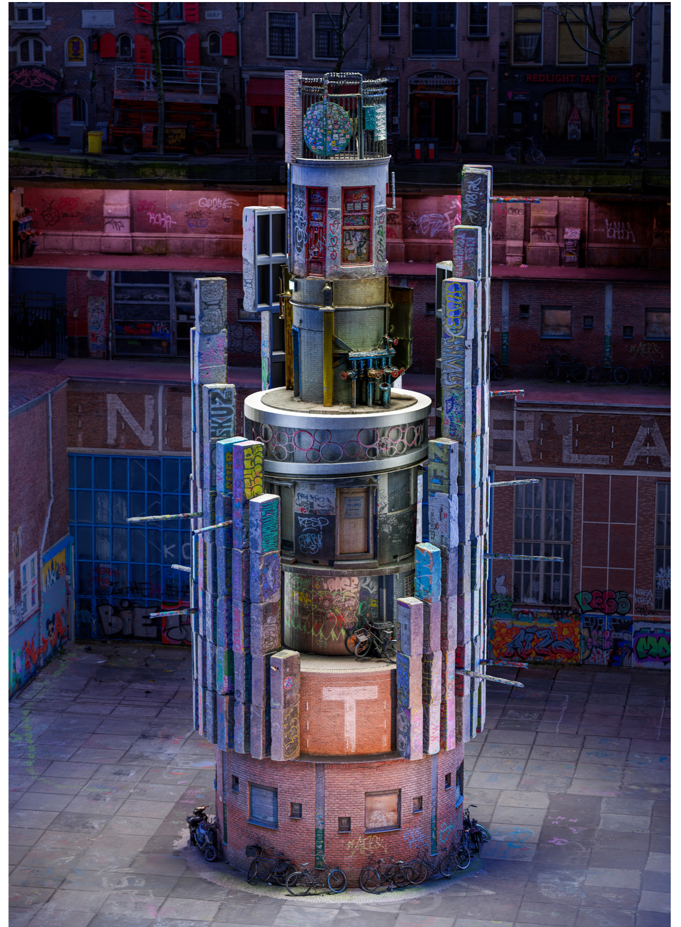
Amsterdam I, 2024 Arşivsel Diasec Baskı | Ed. 5 + 1 Ap | 150 x 100 cm