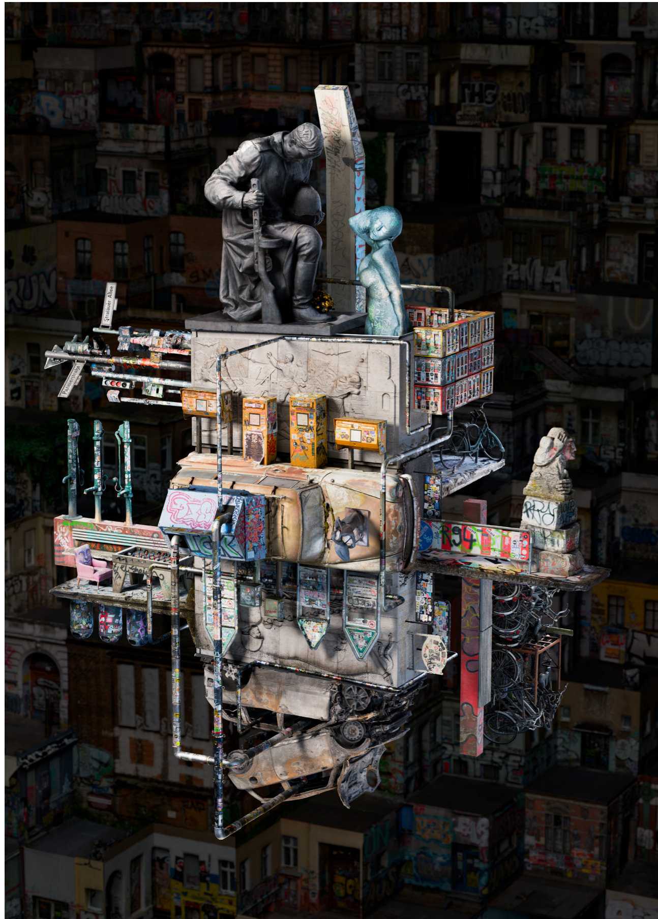
Berlin II, 2024 Arşivsel Diasec Baskı | Ed. 5 + 1 Ap | 150 x 112,5 cm