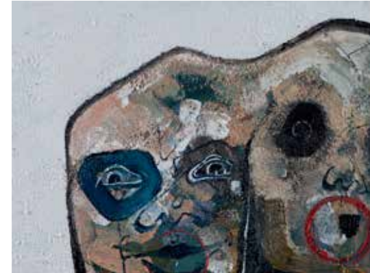
İsimsiz | Untitled 2017

Tuval üzerine yağlıboya | Oil on canvas 30 x 40 cm