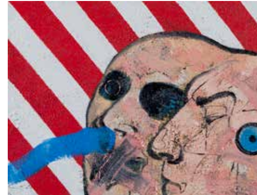
Isimsiz | Untitled 2017 Tuval üzerine yağlıboya | Oil on canvas 30 x 40 cm