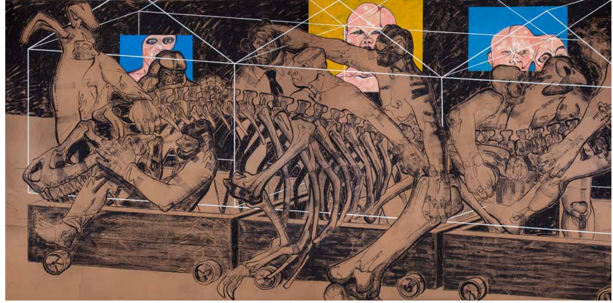
Deliler Treni II | Madness Train II, 2017

Sungur'un kendine has sert ve keskin renkleri, yoğun boya dokusu ve grafik elementleri ile kurduğu katmanlı ve kalabalık kompozisyonları, sanatçının, insan doğasını, evrimi, varoluşu ve iktidar ilişkileri bağlamında ele aldığı kadın-erkek, sivil-politik, ölüm-yaşam, doğa-insan gibi karşıtlıkları sorguladığı etkileyici bir alan oluşturur. Bu sergide yer alan çalışmalar ise ele alınan meselelerin içinde barındırdığı olumsuzluk ve dramatik havaya tezat oluşturacak biçimde kullanılan renklerin canlılığı ve armonisi ile neşeli ve umut verici bir yörünge yaratır.